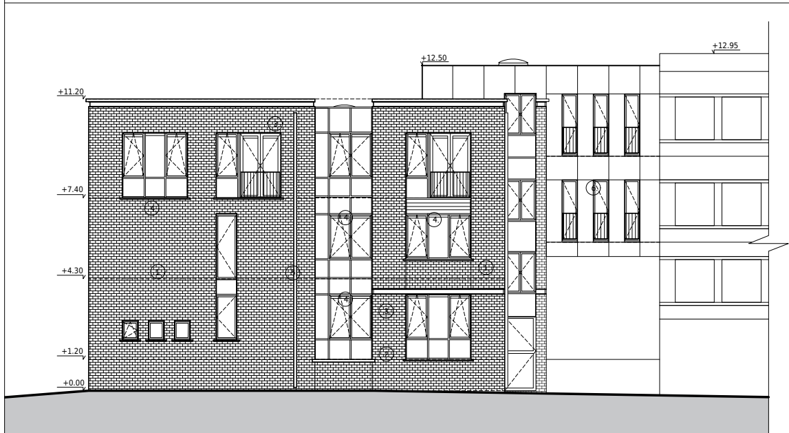
Situation existante - Bâtiment 'B4' Elévation nord 1/200