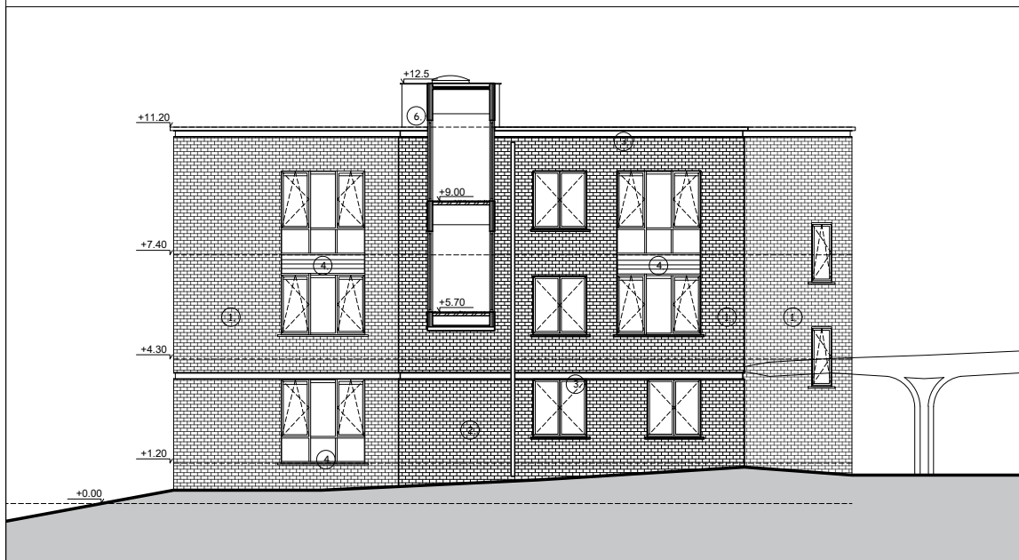
Situation existante - Bâtiment 'B4' Elévation ouest 1/200