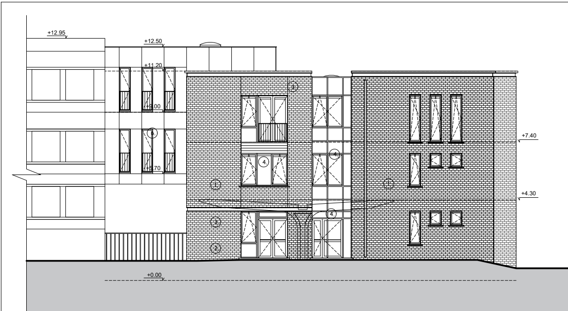
Situation existante - Bâtiment 'B4' Elévation sud 1/200